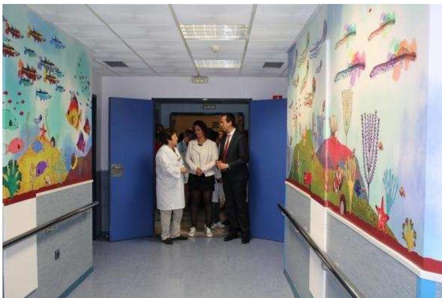
Nuevo aspecto del área infantil de Oncología. La Voz.

Ha sido posible gracias a la colaboración de la Asociación de Padres de Niños Oncológicos Argar